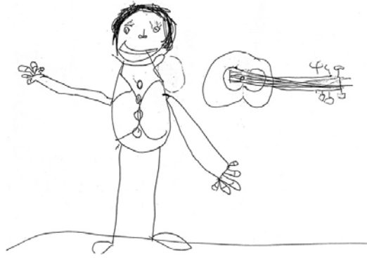
Dessin de David.